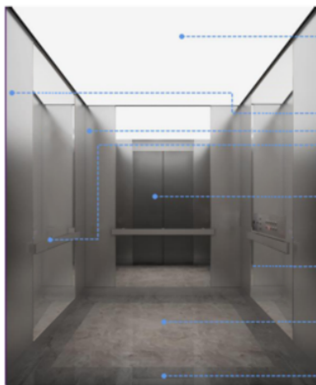
电梯轿厢方案——无障碍电梯