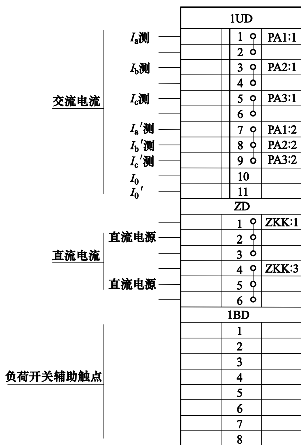
图1 进、出线柜端子排图