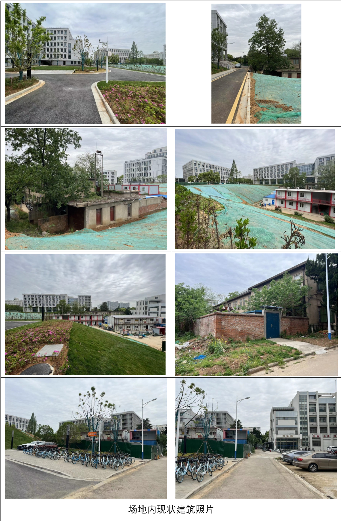
场地内现状建筑照片