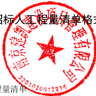
表 1-7 招标人供应材料价格表