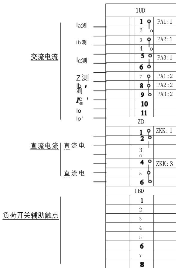
图1 进、出线柜端子排图