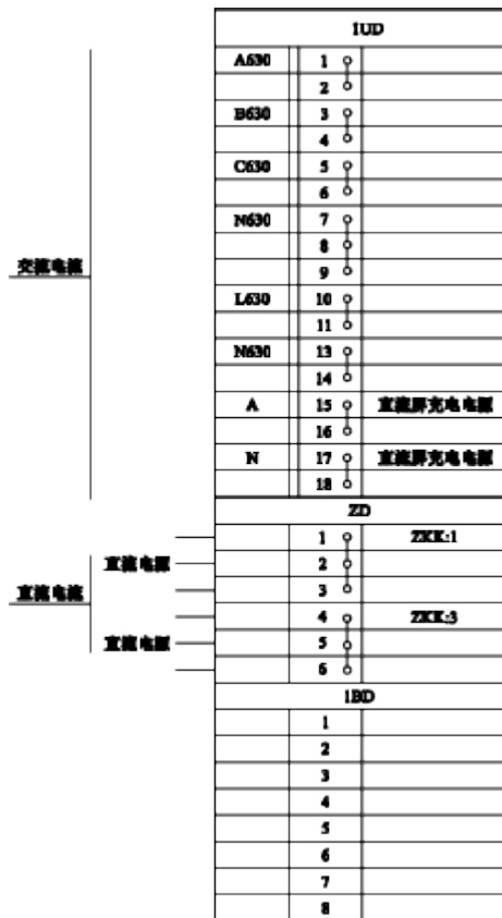
图3 电压互感器柜端子排图