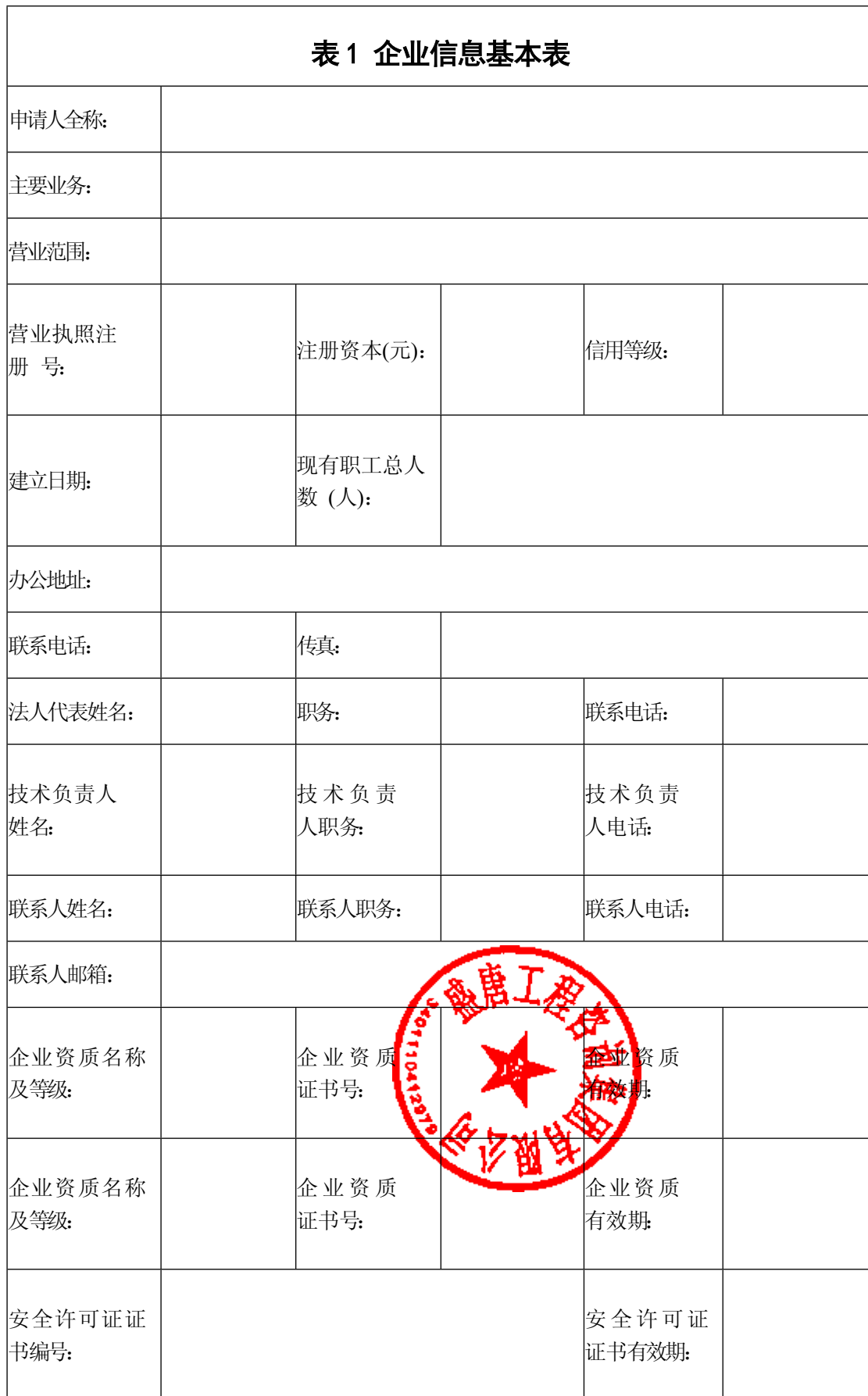
表 1 企业信息基本表