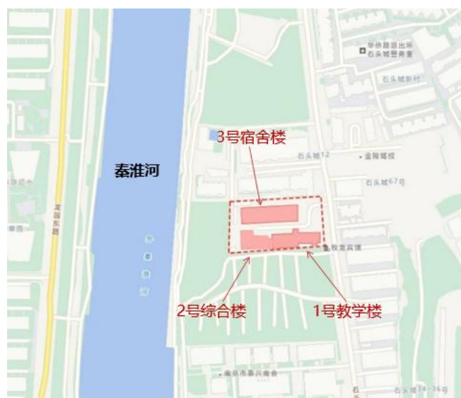
图 2-1 工匠学院位置示意图

工匠学院场址位于石头城路 68 号，具体位置为鼓楼区石头城路西侧、秦淮河东侧、石榴财智中心北侧，总占地面积 5397.3m 2 （合 8.1 亩）。院内为一个自成体系的院落，学校内部主要有 1#教学楼、2#综合办公楼、3#宿舍楼三栋主要建筑，以及泵房、门卫、车棚等辅助用房。工匠学院地理位置优越，交通便捷，地势平坦，环境安静，市政设施配套齐全。工匠学院位置如下：